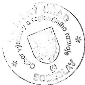
Ing. Dana Hořická v. r. vedoucí odboru výstavby a RR

Rozhodnutí má podle § 93 odst. 1 stavebního zákona platnost 2 roky. Podmínky rozhodnutí o umístění stavby platí po dobu trvání stavby či zařízení, nedošlo-li z povahy věci k jejich konzumaci.